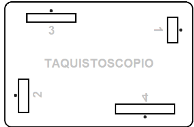
Anexo 1.7. Taquistoscopio